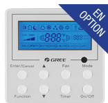
Thermostat filaire (XK-41)