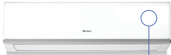
Unité murale LOMO