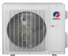
Condenseur LOMO 23