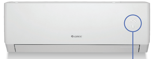
Unité murale Crossover