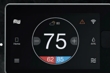
Thermostat intelligent EcoNet