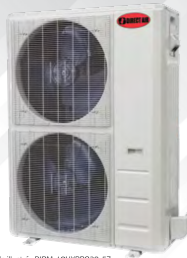
Modèle illustré : DIRM-48HXPRO28-5Z