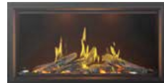
TALL VECTOR AVEC BÛCHES LUMINEUSES